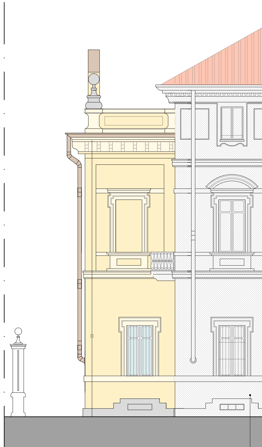
FACCIATA D (EST - SU VIA DANTE)