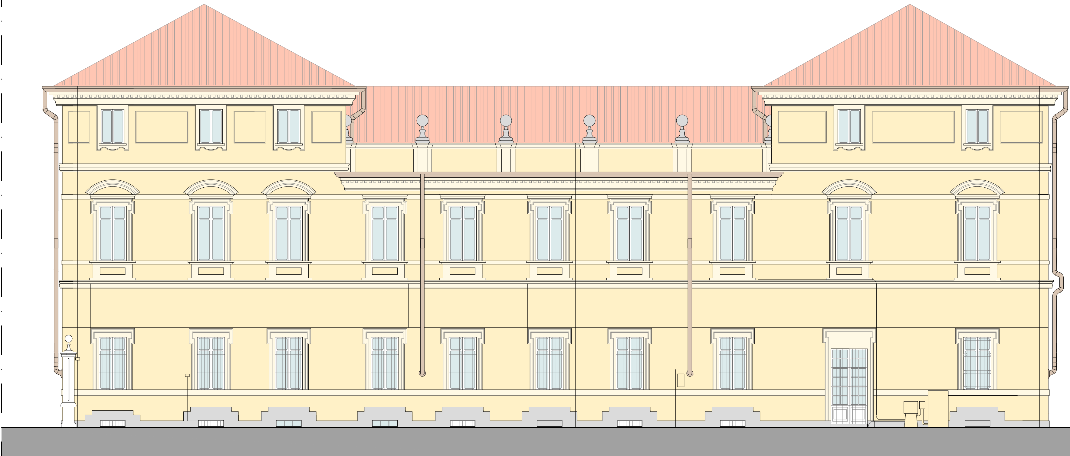
FACCIATA A (NORD - SU VIA TRENTO)