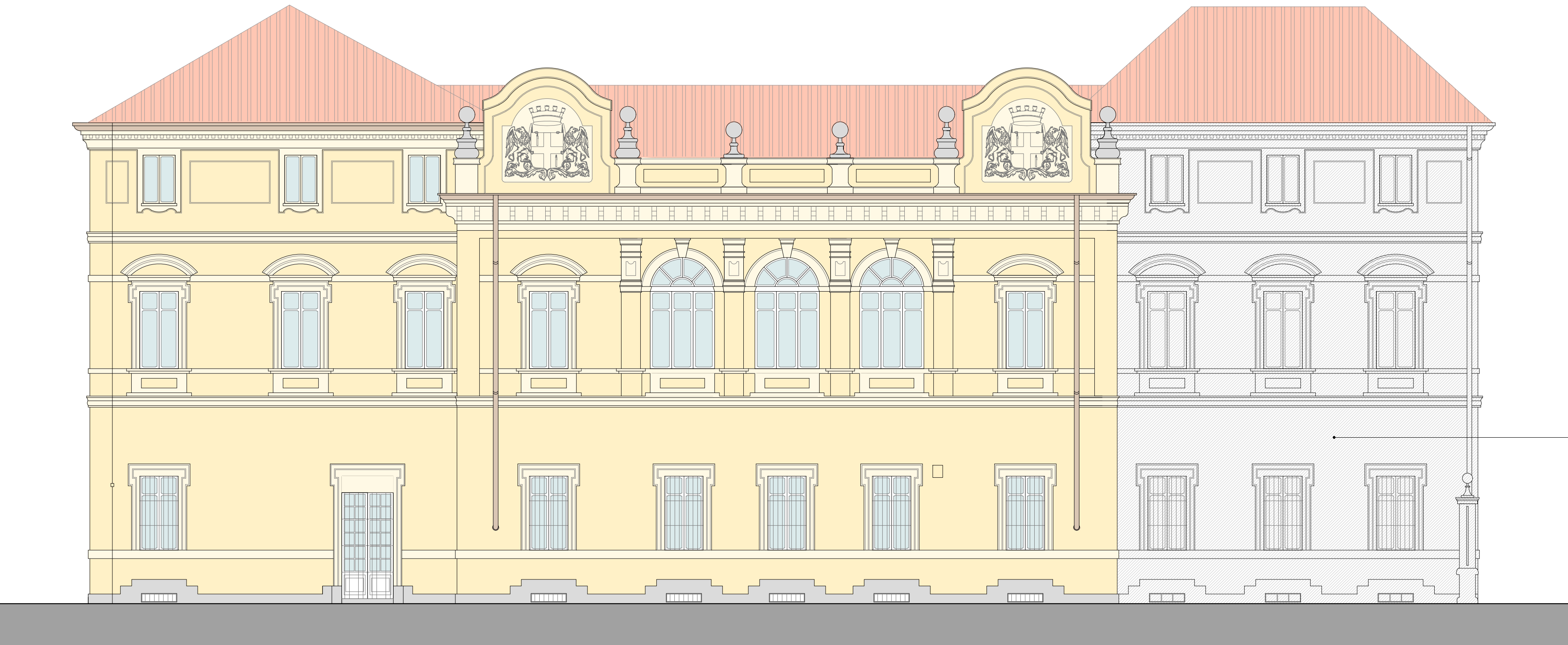
FACCIATA B (SUD - SU VIA TRIESTE)

PORZIONI DI FACCIATA NON OGGETTO DI INTERVENTO (RESTAURATE NEL 2017)